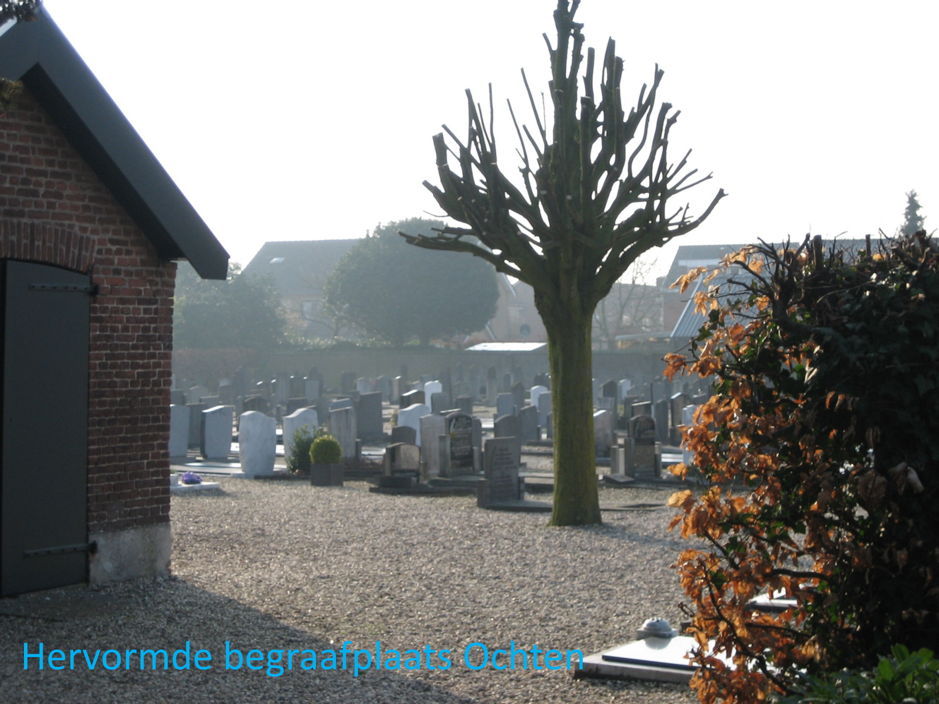
Hervormde begraafplaats Ochten